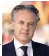
Christophe BÉCHU Maire d'Angers, Président d'Angers Loire Métropole

L'Anjou célèbre La Petite Reine au féminin !